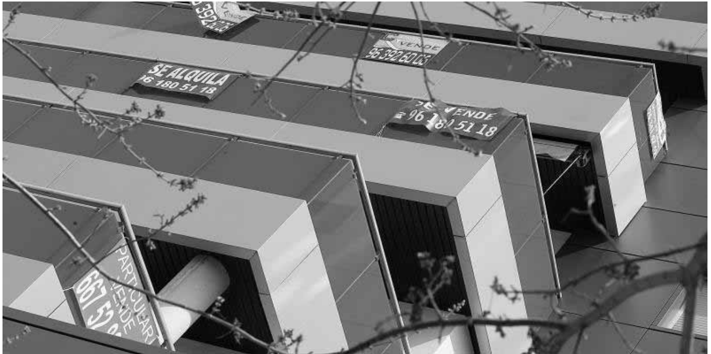
SE VENDE. La crisis económica ha causado que muchos pisos tengan que salir a la venta, como en este edificio de Valencia.

Castellón cuenta con 30 inmuebles disponibles cada 1.000 habitantes