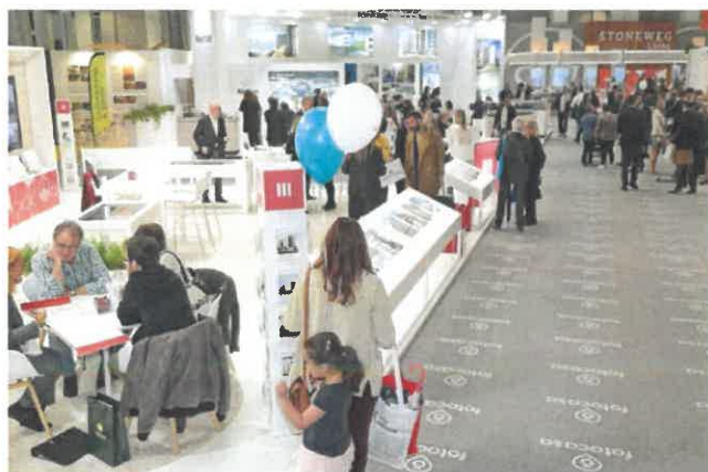
Anteriores ediciones del Barcelona Meeting Point (BMP)

Salas Lab también está diseñado para un público infantil