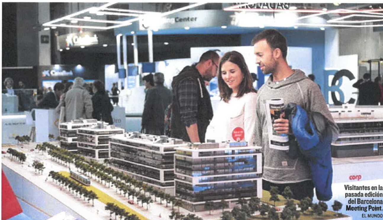
Visitantes en la pasada edición del Barcelona Meeting Point.